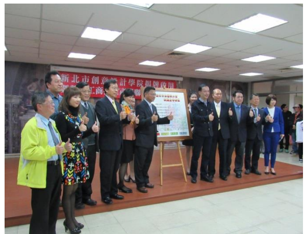
新北市創意設計學院揭牌啟用 暨鶯歌工商技職產學聯盟簽訂儀式