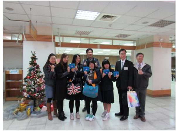
日本學校師生參訪