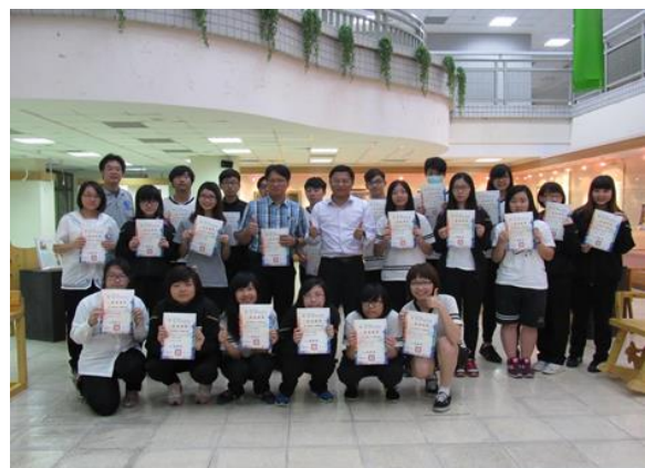
美工科創意木椅專題製作展