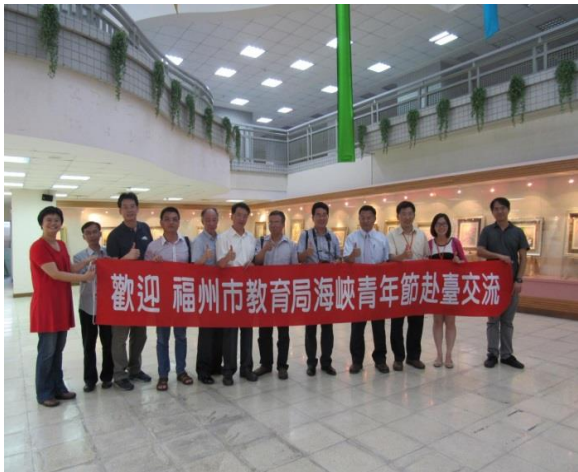
福州市技職教育交流團蒞校交流活動