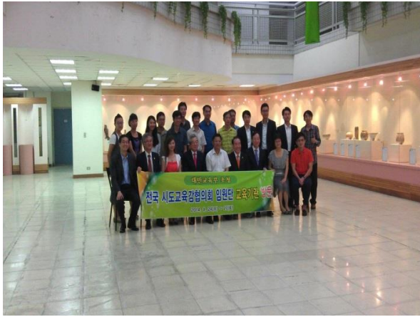
韓國全國市道教育監協議會蒞校參訪