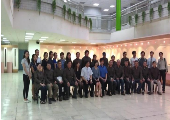
陶工科師徒拜師大典