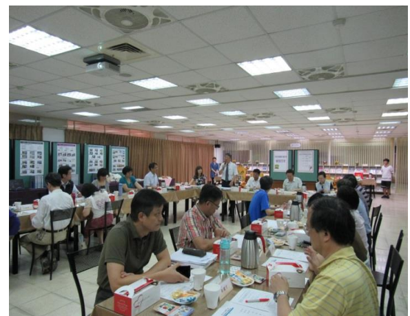
103 學年度優質化輔導訪視