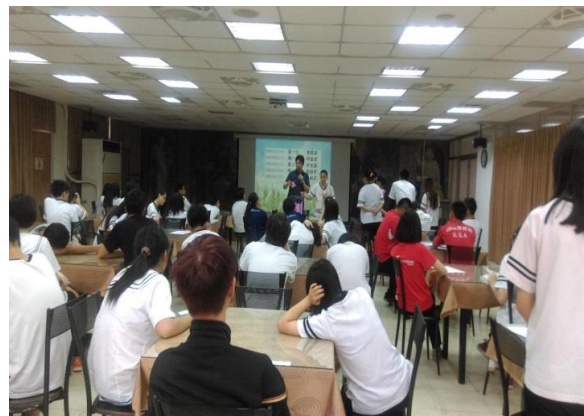
鼓勵閱讀摸彩活動