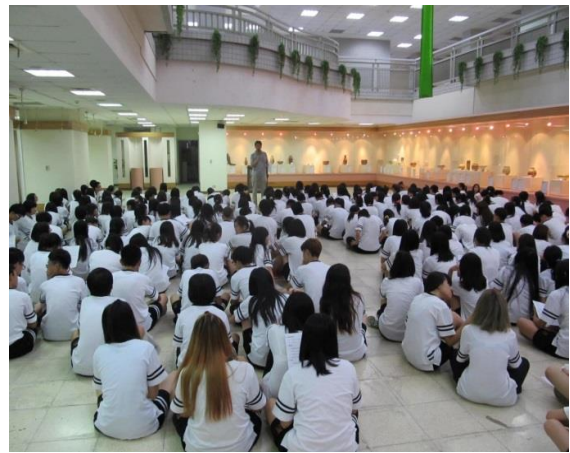
103 學年度新生圖書館利用教育訓練