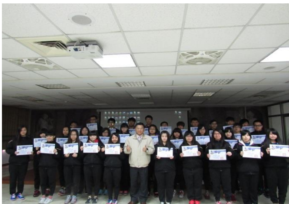
中學生小論文暨讀書心得寫作比賽頒獎