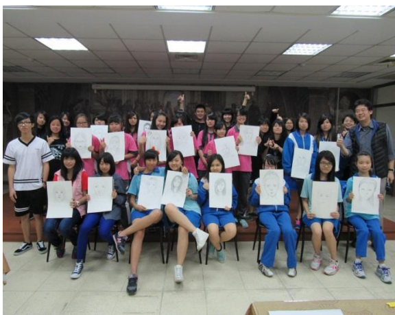
國中生技職課程體驗營