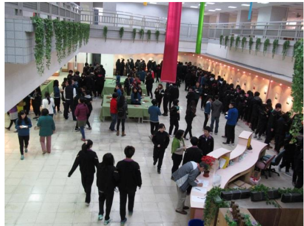
美工科文創伴手禮 茶文化茶器設計展