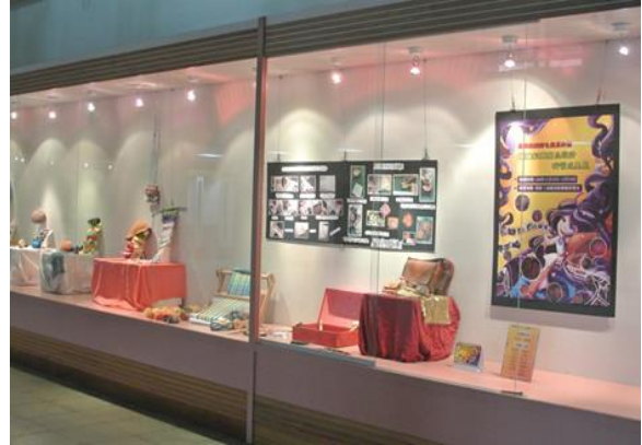
編織彩雕文創商品展