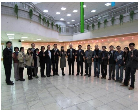
臺北商業大學蒞校締結策略聯盟茶敘