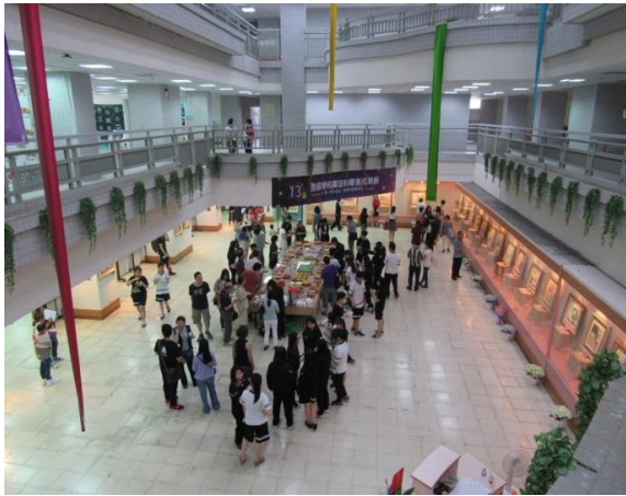
進修學校廣設科第十三屆畢業成果展