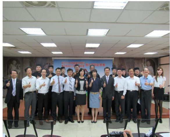
新北市 104 年度高級中等學校專任教師赴公民營機構研習聯合開訓記者會